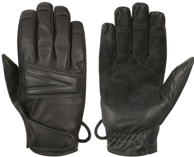
RENCY Short Black